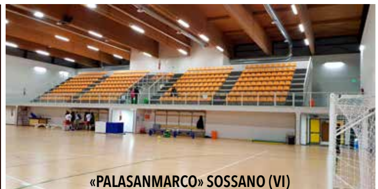
«PALASANMARCO» SOSSANO (VI)